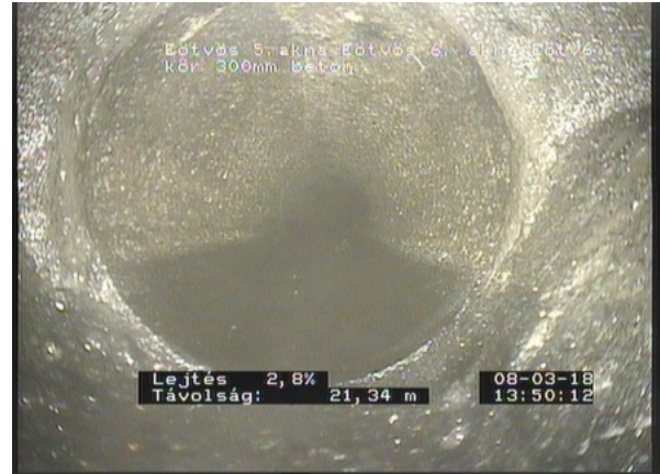
Eötvös 6_3da3f8da-4231-4d3c-806b-c6be5d734ab3_20180308_1352 11_640.jpg, 00:05:08, 21.34