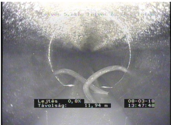
Eötvös 6_13088fd0-2c97-4cc0-8007-ec6982ccfb4e_20180308_1349 47_530.jpg, 00:02:54, 11.94