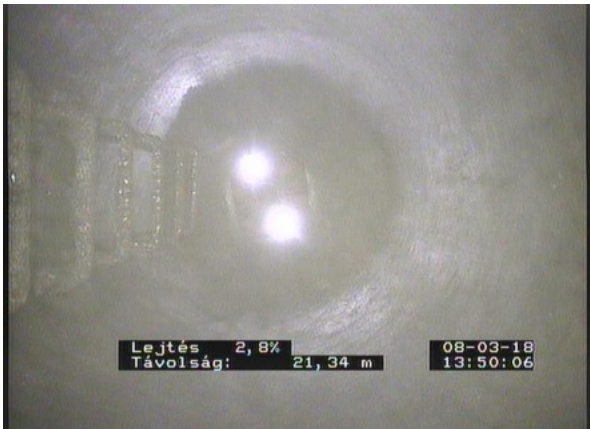
Eötvös 6_a8604373-1f79-43fa-a389-81b6898b94a0_20180308_1352 05_598.jpg, 00:05:08, 21.34